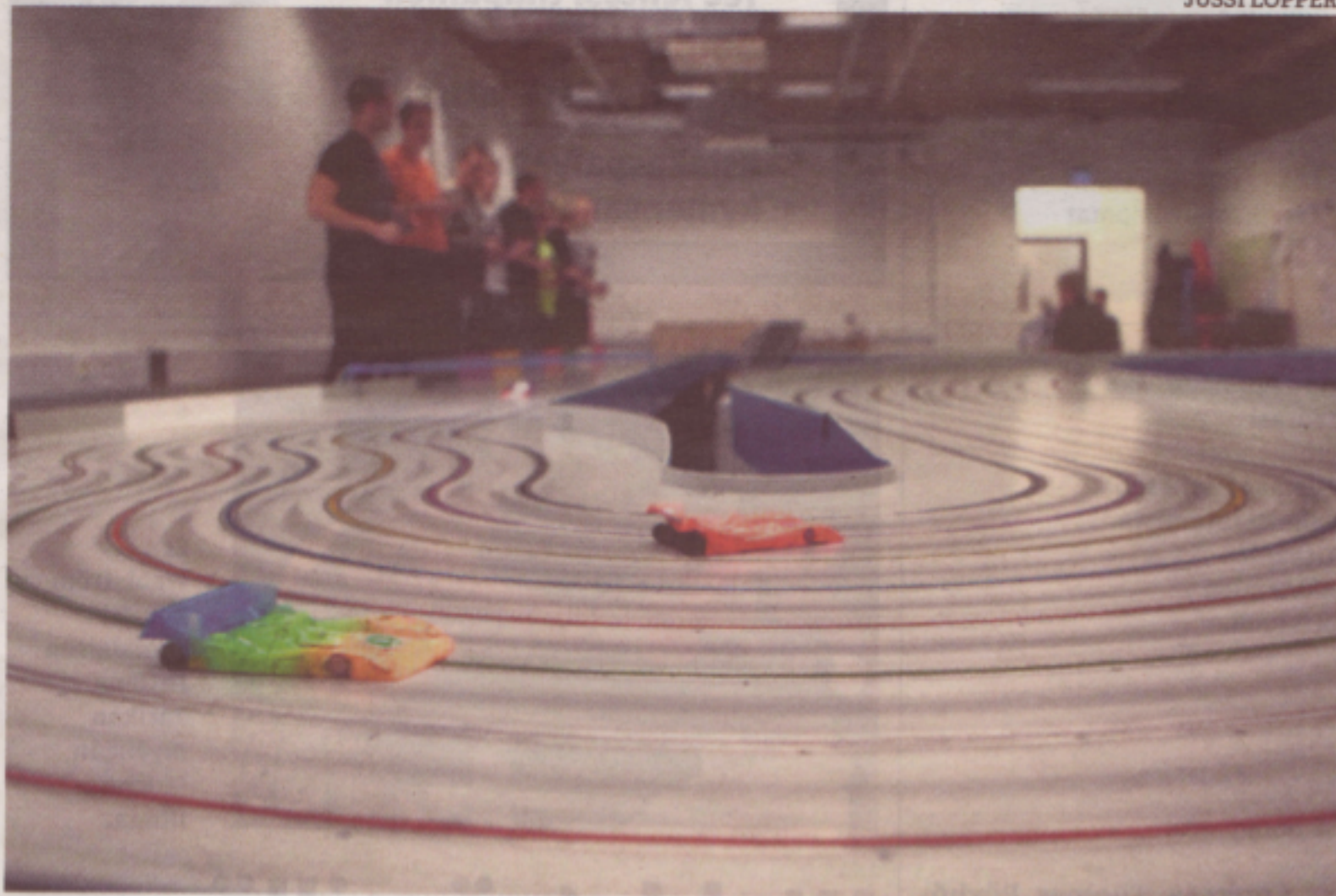
Pienoissähköautollun Eurosarjan 4. osakilpailu ajettiin viikonloppuna Kotkassa. Ajajat seisovat korokkeella vierekkäin.